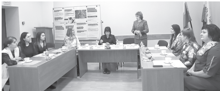
Первое заседание комитета семей воинов Отечества было продуктивным