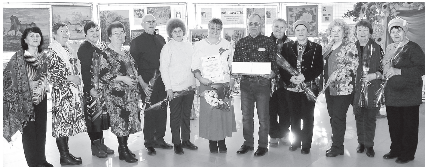
Члены местного отделения регионального центра «Серебряные волонтеры Белгородчины»

С 2017 года в России отмечается День добровольца, учрежденный в честь людей, посвятивших свои жизни благотворительности и взаимопомощи.