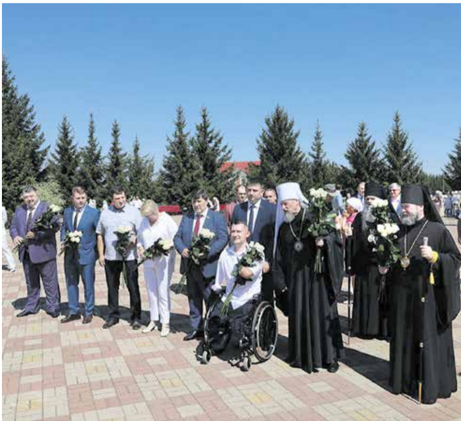
Члены официальной делегации возложили цветы к Звоннице

«Любовь к Родине и близким помогла нашим людям выстоять и преодолеть