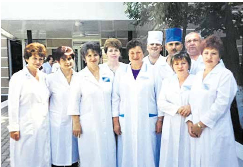
Часть большого дружного коллектива Ракирянской ЦРБ