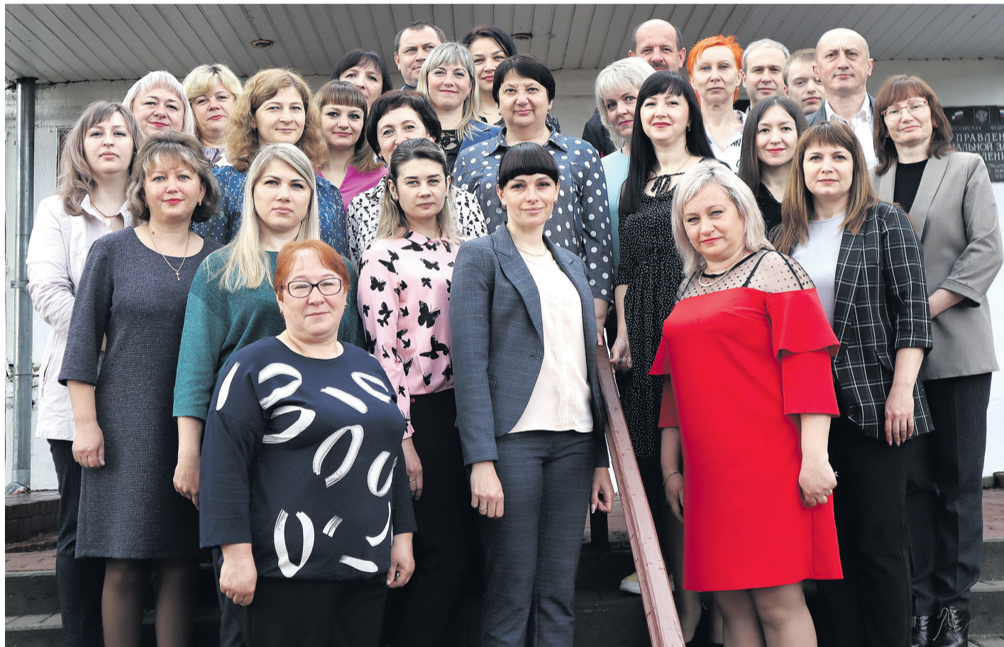
Коллектив управления социальной защиты населения Ракитянского района всегда готов оказать необходимую помощь

Система социальной защиты населения сегодня представляет собой сеть разнопрофильных направлений, где заняты работники одной из самых сложных профессий, которая требует не только глубоких знаний, высокой квалификации, умения мобилизоваться в чрезвычайных ситуациях, но и особого душевного склада.