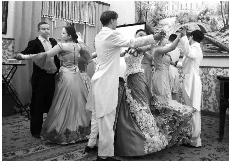
Вальс под музыку Арама Хачатуряна к драме М.Ю. Лермонтова «Маскарад»