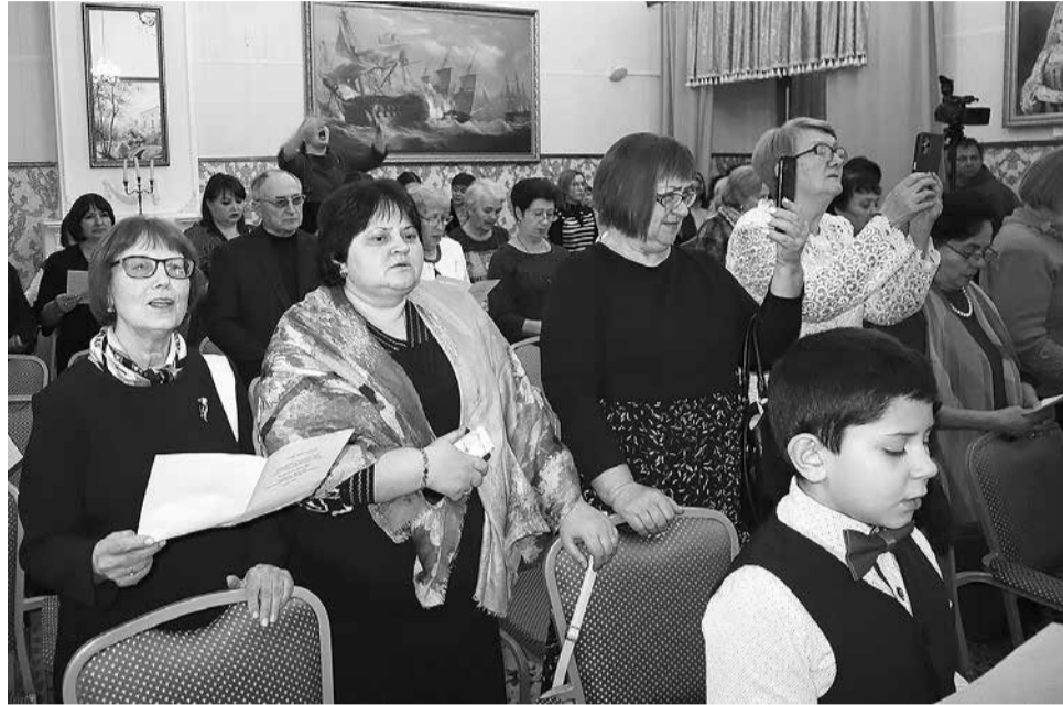
Общее песнопение ещё сильнее объединило присутствующих