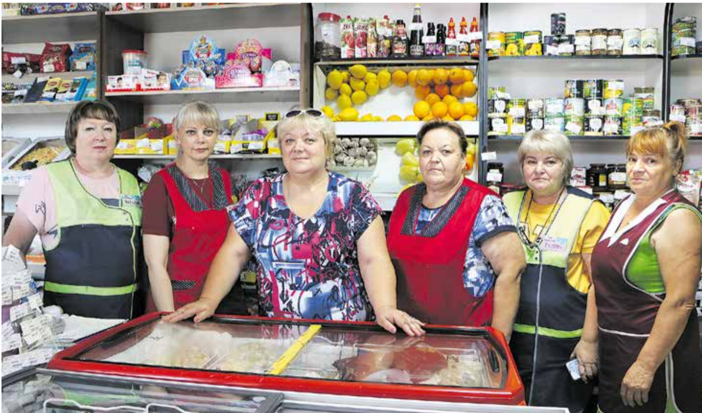
Коллектив магазина «Ольга» дружный и слаженный, поэтому торговый объект уже много лет работает как часы

Ежегодно в четвёртую субботу июля в России отмечается День работника торговли. Праздничная дата была утверждена в 1966 году указом Президиума Верховного Совета.