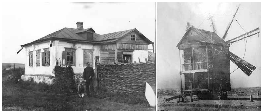
Хата в селе в довоенное время и дмитриевский ветряк