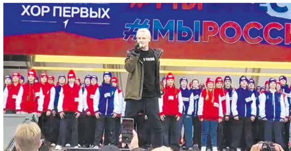
Шаман с ребятами исполняют гимн России

Международная выставка-форум «Россия» начала работу 4 ноября на площадке ВДНХ в Москве и будет проходить до 12 апреля 2024 года. Свои экспозиции представили все регионы России. Выставку посетят гости из СНГ, Латинской Америки, арабских государств и других дружественных стран. Подготовка к событию заняла семь месяцев.