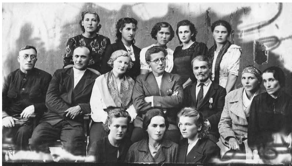
Делегация Ракитянского района на 2-м областном съезде учителей в августе 1945 года в г. Курске