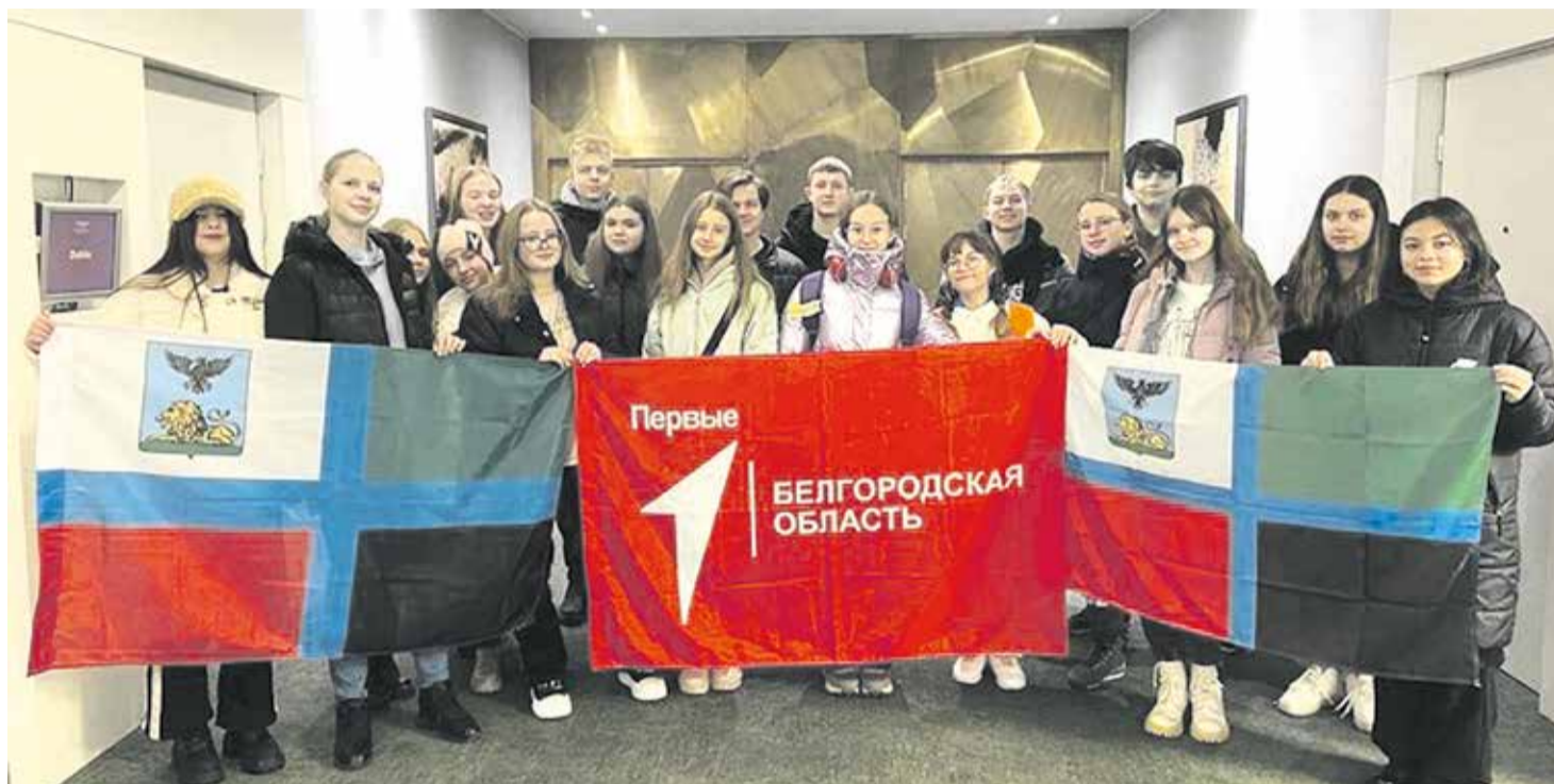
Белгородские участники «Хора Первых»

цветные шапочки, перчатки и бомберы. Наша делегация получила красную одежду. На сцене всё это смотрелось просто супер!