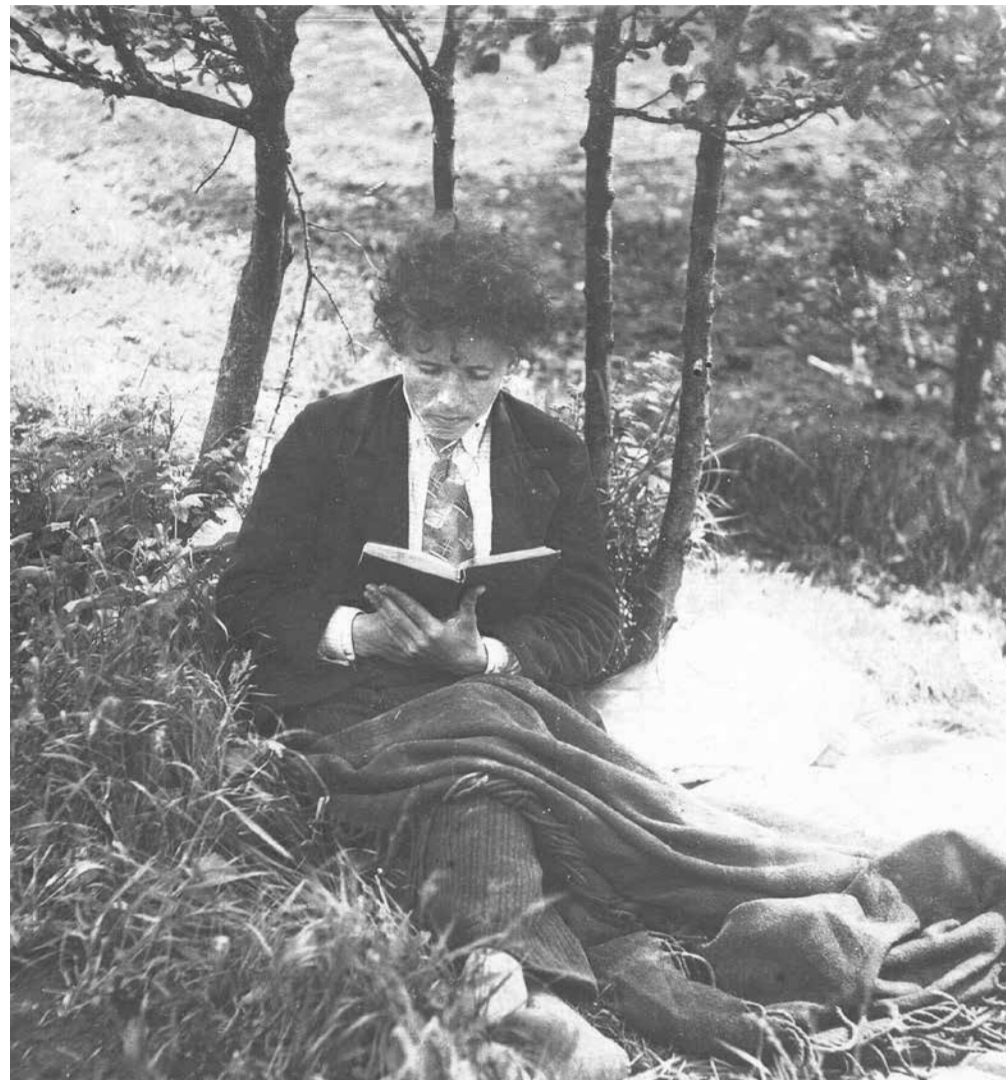
В свободное время. 1938 г.