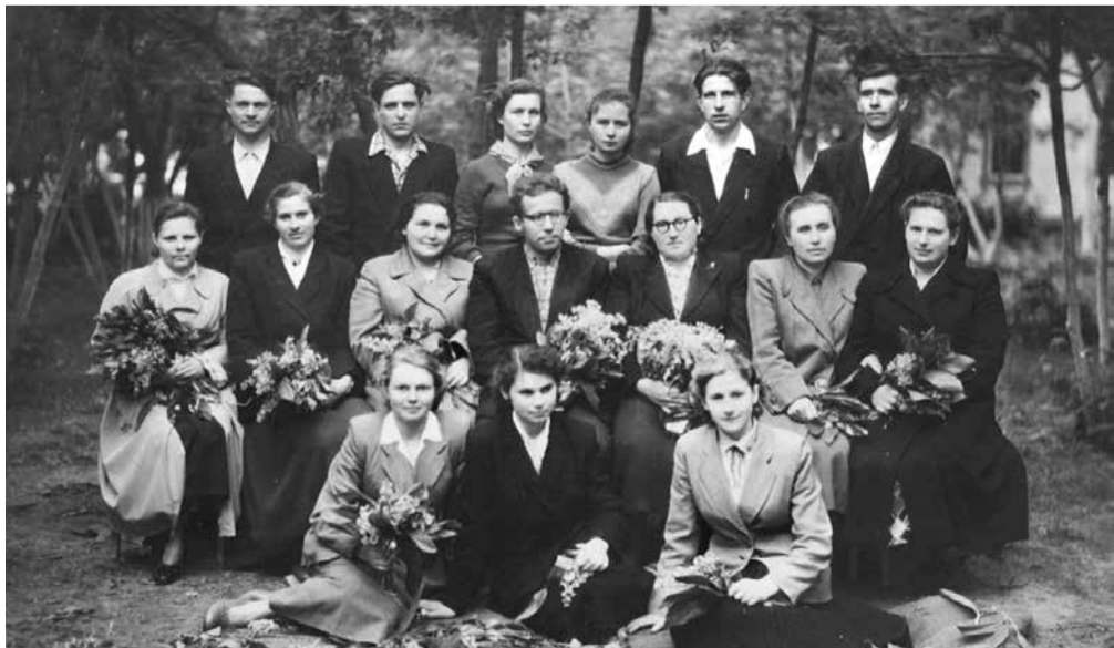
Учителя Дмитриевской средней школы. 1959 г.