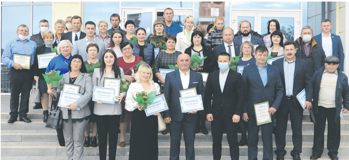
После плодотворной встречи участники форума сфотографировались на память на крыльце Сахзаводского культурно-спортивного комплекса

Территориальное общественное самоуправление – это эффективная форма реализации собственных инициатив граждан, направленных на улучшение качества жизни людей на своей территории. Федеральное законодательство определяет ТОС как «самоорганизацию граждан по месту их жительства на части территории поселения для самостоятельного и ответственного осуществления собственных инициатив по вопросам местного значения».